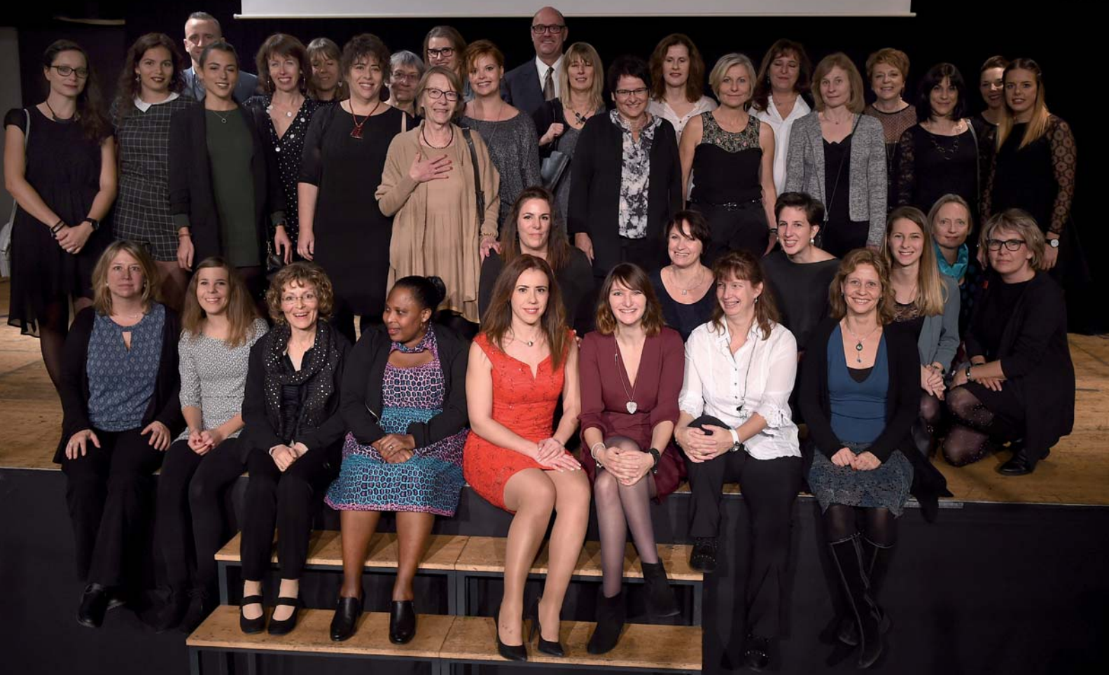
L'équipe de Pro Senectute Arc Jurassien