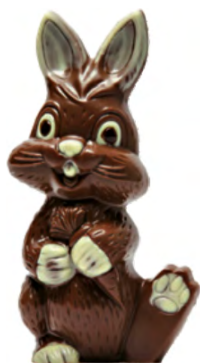
Lapin au chocolat vendu dans le cadre de l'action « Un lapin pour un sourire » du Lions Club Boudry – La Béroche