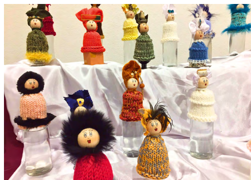
Figurines réalisées par Mme Myriam Gerber et vendues au profit de Pro Senectute Arc jurassien